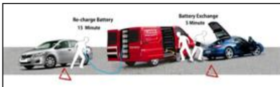
[ 그림 ] 교환형 배터리